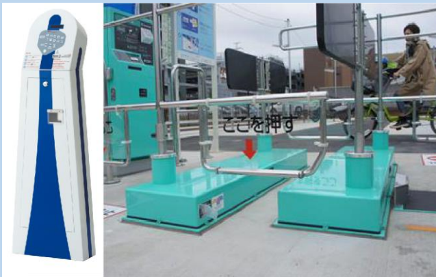
東海技研株式会社

先進的でスタイリッシュ、機能的なゲート式駐輪システム「サイクルン」、シェアサイクルシステム