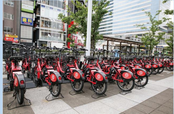
株式会社ドコモ・バイクシェア