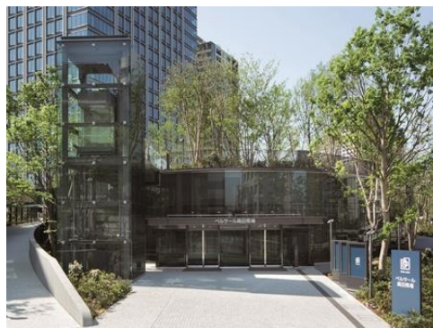
<ベルサール高田馬場エントランス>