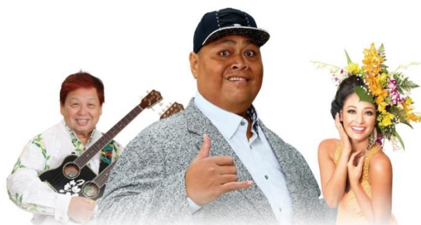
高木ブー、KONISHIKI、アリアナ・セイユ